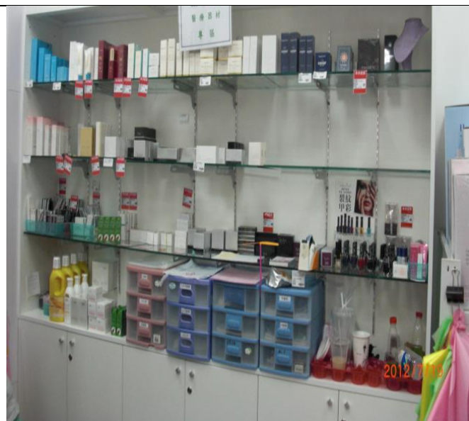
3. 醫療器材放置區相片