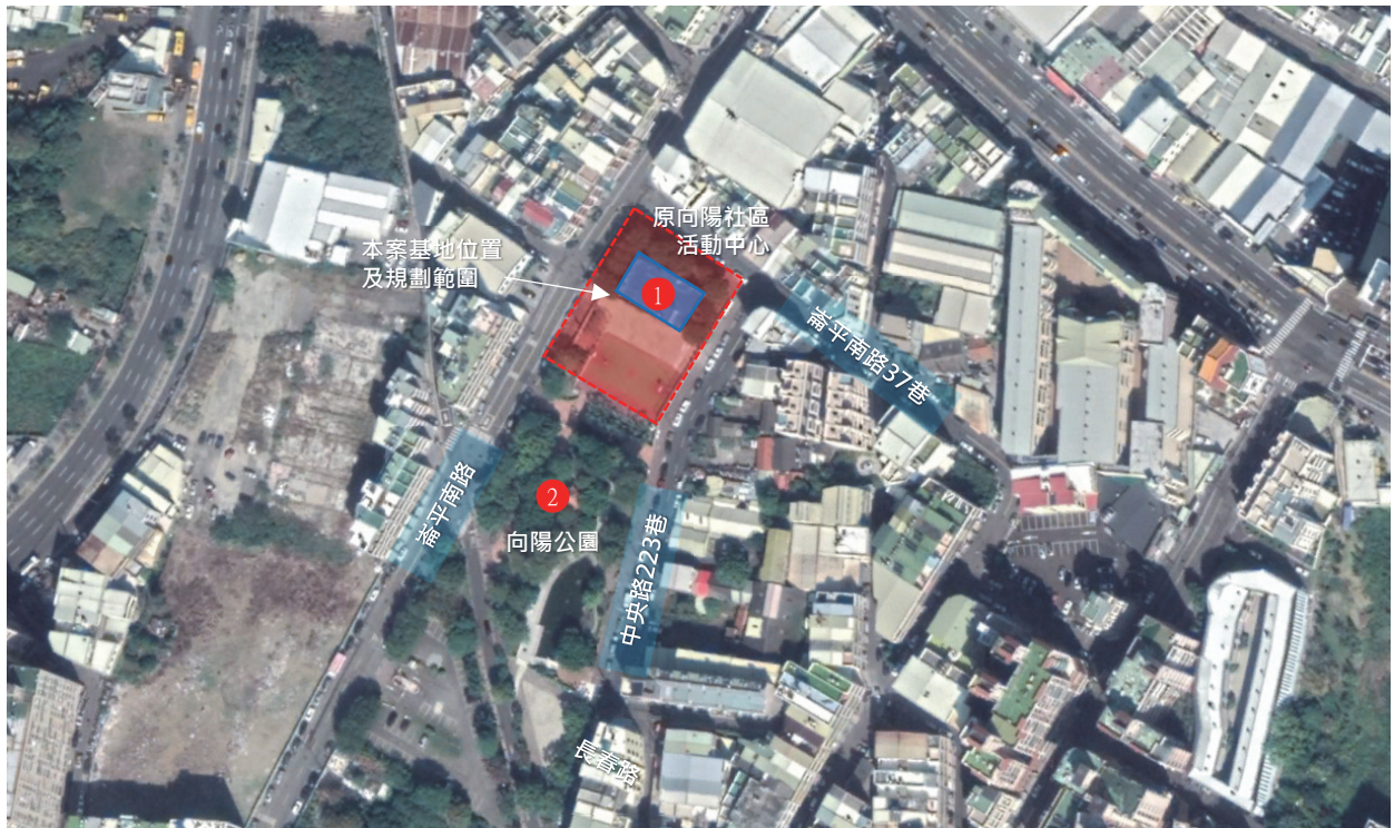
本案計畫範圍衛星圖