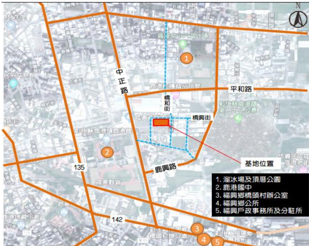
▲基地周邊道路系統示意圖