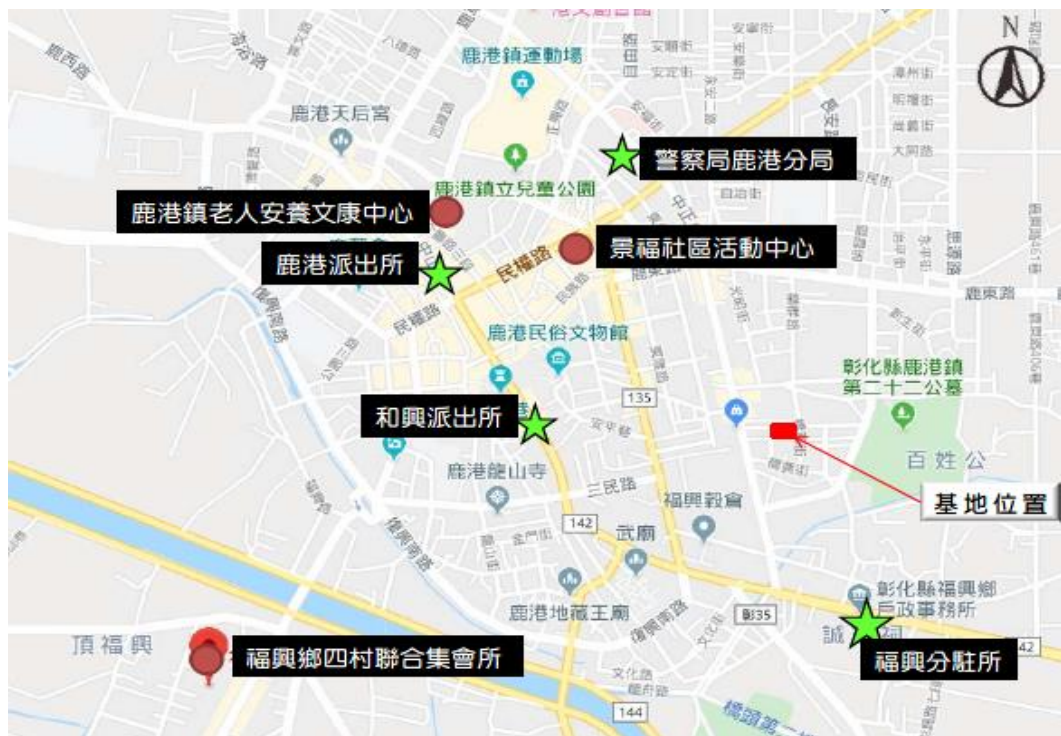
▲基地周邊分駐所、集會所及社區活動中心分布示意圖

彰化縣鹿港區綜合行政大樓混合型日照中心示意圖 彰化縣衛生局保有最終修改、變更之權利