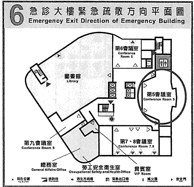
高雄榮民總醫院交通指引路線圖